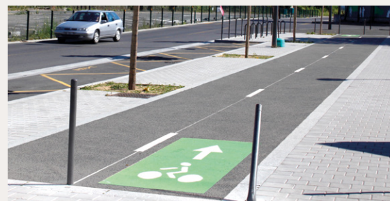
■ Vue de l'avenue Carnot