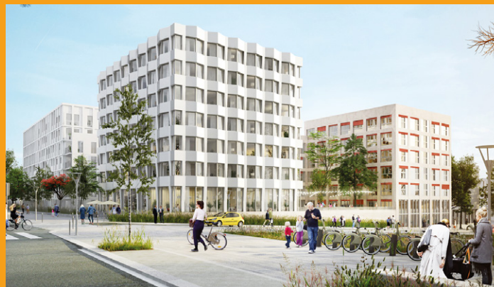
■ Hôtel – Architectes Lambert Lénack

Vont sortir de terre entre 2019 et 2020, à l'angle des rues Migaux, Galvani, et Bougainville, 114 logements étudiants et un nouvel hôtel B&B de 128 chambres qui partageront une terrasse, ainsi que 106 logements en accession libre équipés de loggias, terrasses et jardins offrant ainsi aux futurs résidents, un lieu de vie agréable et ouvert sur l'extérieur. ■