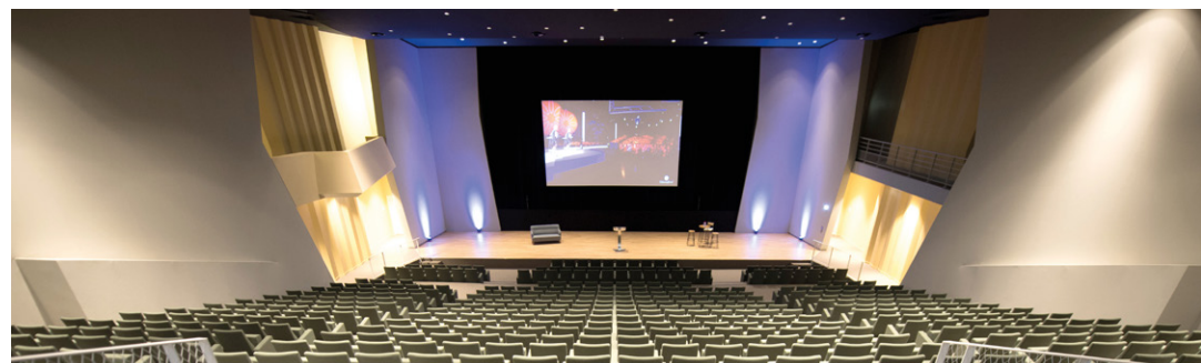
■ Vue de l'auditorium de 600 places