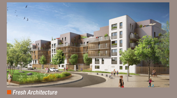
■ Fresh Architecture

Situés face au mail du commandant Cousteau et à proximité du parc des Tuileries, ces logements (accession libre ou locatif intermédiaire) seront livrés à la fin de l'année 2018 par les promoteurs Emerige et Linkcity. Après la phase du gros-œuvre, les façades vont maintenant se parer de briques blanches vernissées et de bois, qui mettront en valeur ce nouveau bâtiment, véritable repère dans la perspective du mail. ■