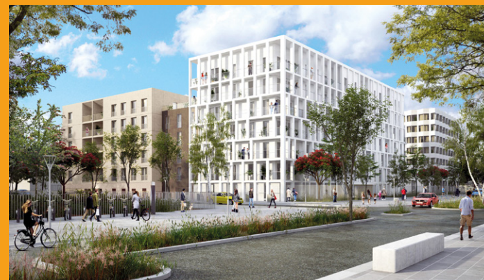
■ Logements – Architecte MPA