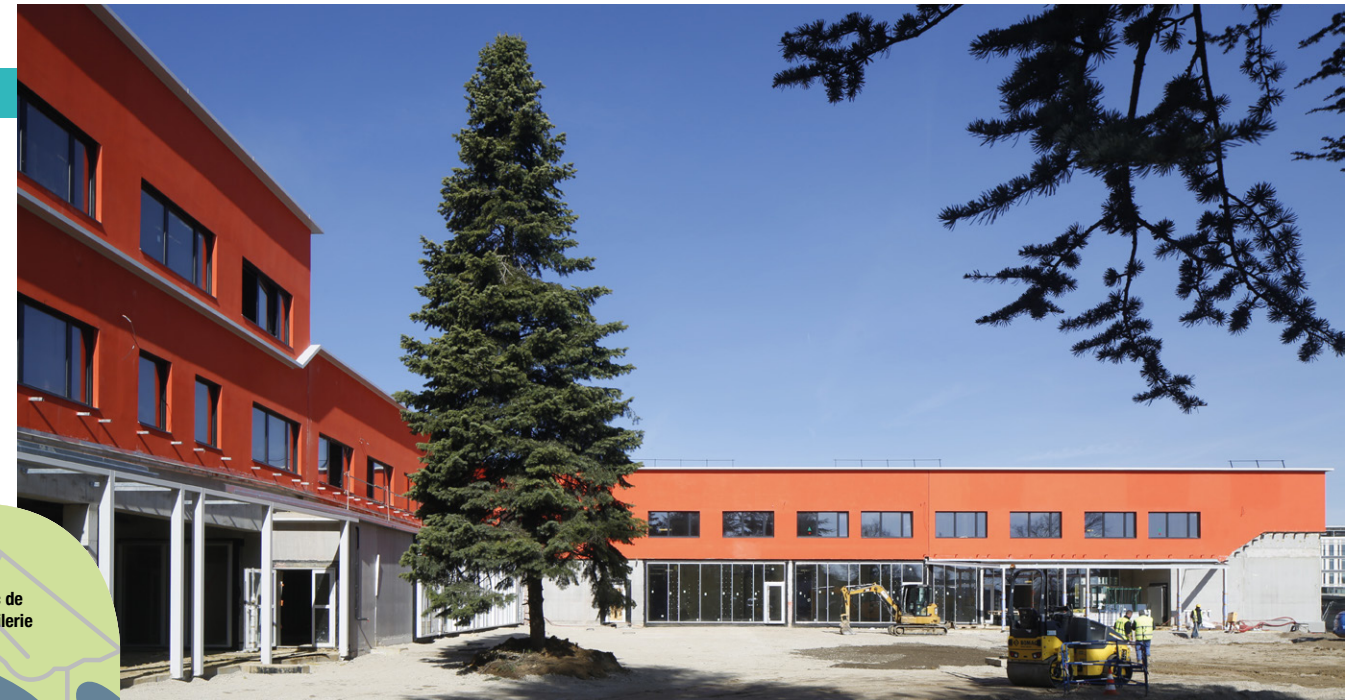
■ Vue de l'école Rosa Parks