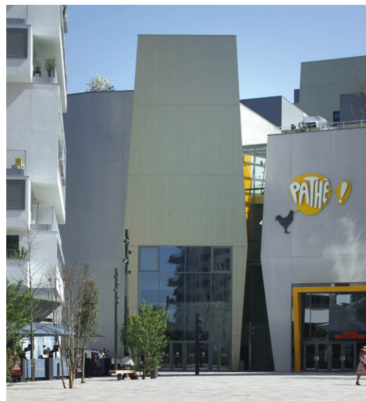
■ Façade du Palais des Congrès, Place du Grand Ouest

Ouvert depuis avril dernier sur la Place du Grand Ouest, le Palais des Congrès Paris Saclay, dessiné par l'architecte Christian de Portzamparc, inscrit définitivement Massy sur la carte des villes qui comptent en Île-de-France. Géré par Châteauform', spécialiste de l'organisation de séminaires d'entreprise, il a vocation à devenir un lieu d'échange tant pour les entreprises et les collectivités, que pour le grand public, en accueillant salons, événements professionnels, expositions et spectacles. Fort de ses 5 500 m 2 de superficie, ce lieu unique en Essonne a été pensé pour recevoir des événements de grande envergure et peut accueillir jusqu'à 1 500 personnes grâce à une salle d'exposition de 1 000 m 2 , 8 salles de réunions, un auditorium de 600 places et 2 espaces de convivialité. Avec une décoration qui fait la part belle au végétal, des salles modulables qui peuvent s'adapter à une multitude de configuration d'événements, Châteauform' propose un Palais des Congrès atypique qui accroît sensiblement le rayonnement de Massy au sein du Grand Paris. ■