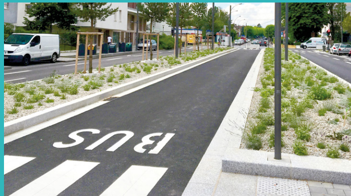
■ Vue de l'avenue de Paris

L'avenue de Paris offrira deux bandes cyclables de part et d'autre de l'avenue et deux doubles voies de circulation séparées par un large terre-plein central paysagé qui promet d'accueillir à terme des bus en site propre. ■