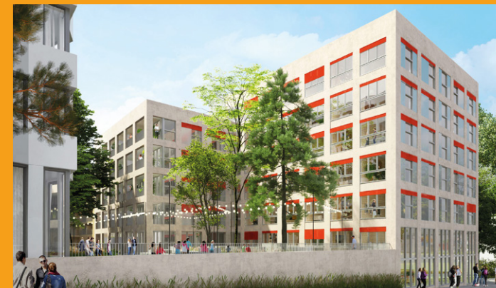
■ Résidence étudiants – Architecte Eric Lapierre