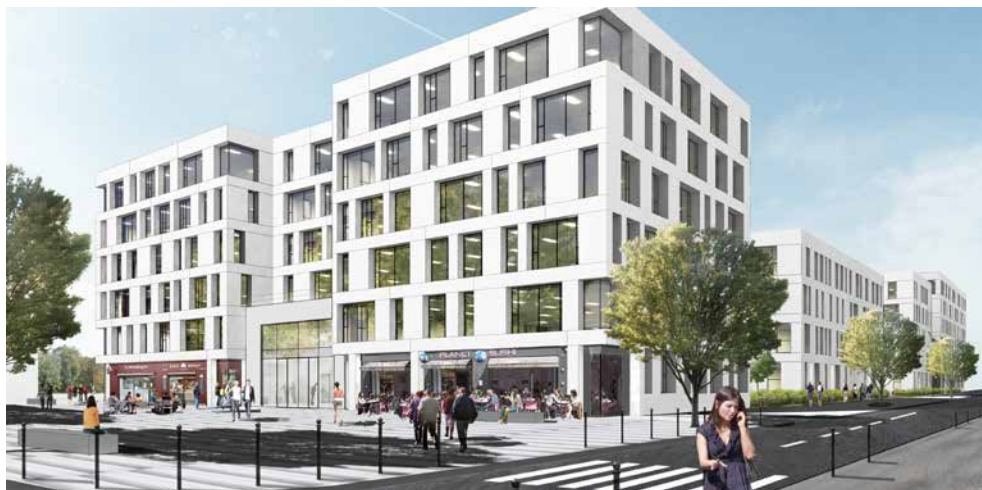
■ Architecte : Simonetti-Malaspina & Associés.

Le cœur du Campus sera entièrement paysager, agrémenté de bassins, et organisé autour d'une allée piétonne privée traversante pouvant accueillir le public dans la journée. On pourra passer tout naturellement de la rue au jardin, et du jardin aux bureaux. Premier coup de pioche annoncé pour mai 2017, pour une livraison de cette première phase fin 2018. ■