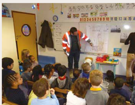
■ L'école des Petits Champs Ronds découvre le chantier de la Place du Grand Ouest.

Ce nouvel équipement, si important pour les petits massicois, va permettre de faire évoluer la carte scolaire de façon transitoire en 2017-2018. Car la grande difficulté est de gérer les ouvertures d'établissements et de classes dans le temps, en prévoyant la montée en puissance de la population d'Atlantis. En septembre 2017, les jeunes enfants résidants autour de la rue Marco Polo et de la place du Grand Ouest vont faire leur rentrée à la maternelle Petits Champs Ronds. C'est le point de départ du processus planifié par le service de l'éducation de Massy. L'école élémentaire Atlantis pourra alors recevoir des enfants qui étaient jusqu'alors scolarisés dans le groupe scolaire L. de Vinci. Celui-ci disposera de plus de place pour accueillir les enfants de la pointe sud du quartier. À la rentrée 2018, l'ouverture du nouveau groupe scolaire Rosa Parks (voir encadré) parachèvera l'équilibre de l'offre scolaire du quartier. ■