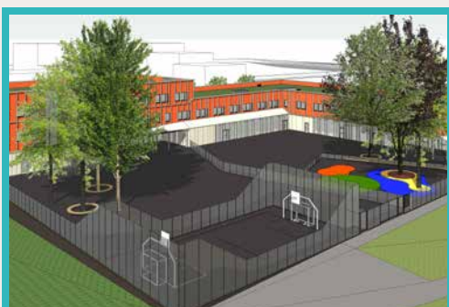
■ Architecte : Pascale Colin