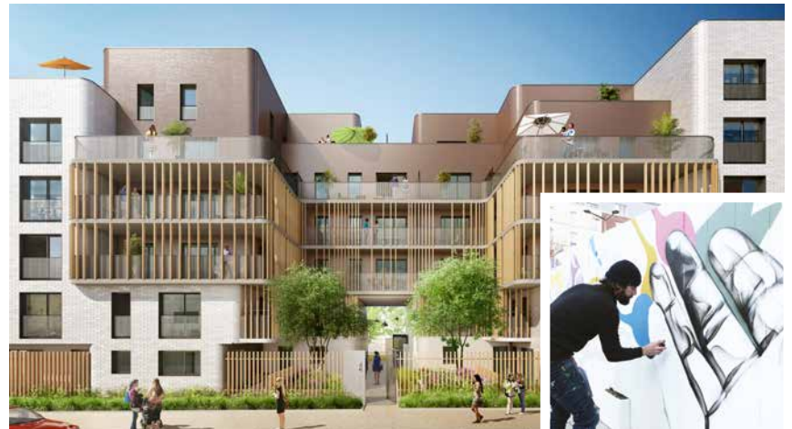
Architecte : Fresh Architectures.