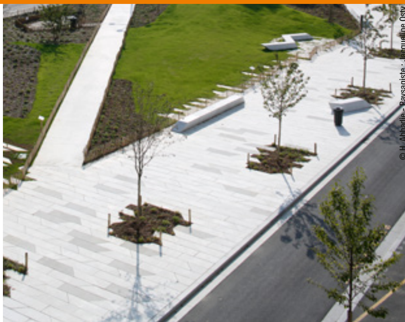
© H. Abbadie - Paysagiste - Jacqueline Osty