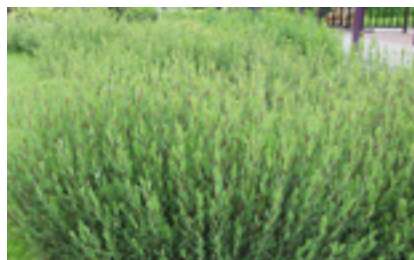
Paysagement en cours de finalisation. Susceptible d'ajustements.