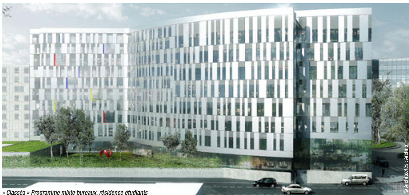
« Classéa » Programme mixte bureaux, résidence étudiants

Dans la perspective d'une appropriation de l'espace par les habitants du quartier, la place sera modulable ; « la surface que représentent la voie de stationnement, la bande cyclable et le trottoir, pourra tout à fait être utilisée à des fins d'animation de vie de quartier : telle qu'une brocante », conclut la coordinatrice du projet. ■