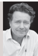
Elisabeth et Christian de Portzamparc, architectes Agence E. et C. De Portzamparc

« Nous proposons un système de places composé de quatre places et une placette qui se succèdent à partir de la gare, de la rue du Grand Ouest et de la rue de Paris. Cela afin d'affirmer une centralité fluide qui se dissémine et se lie au quartier en le ponctuant de lieux publics marquants, attirants et très repérables depuis tous les parcours. L'unité de matériaux et d'éclairage de ces places vient assurer l'identité de ce quartier central. Ce réseau des espaces publics dessert cinq îlots. La rue du Grand Ouest est l'épine dorsale de l'ensemble. Elle devrait être ouverte à l'automobile comme aux piétons afin d'être pratiquée, appropriée et connue de tous. Nous proposons des dispositifs spatiaux innovants qui, par leur structure urbaine et leur composition architecturale, favorisent les rencontres. Le développement de cette vie locale, de ce réseau de voisinage apportera à ce futur cœur de ville une convivialité nouvelle ».