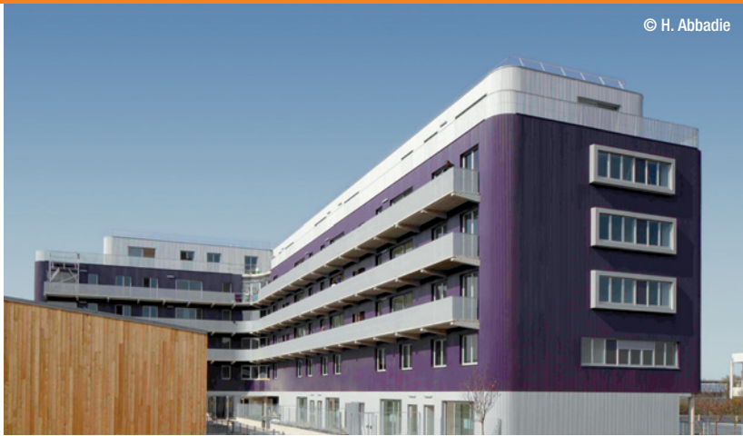
Du Besset - Lyon architectes