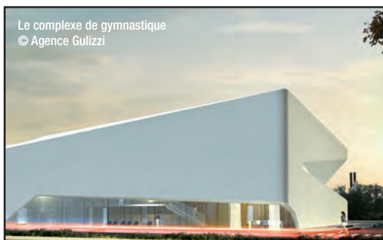
Le complexe de gymnastique

création d'espaces publics, places, mails et jardins, participent à la nouvelle échelle urbaine du quartier. ■