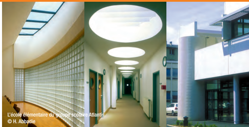
L'école élémentaire du groupe scolaire Atlantis